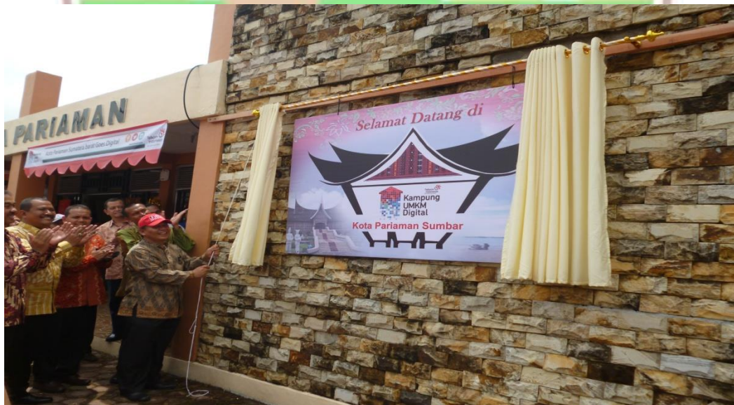
Gambar 4.4 Kampung Digital