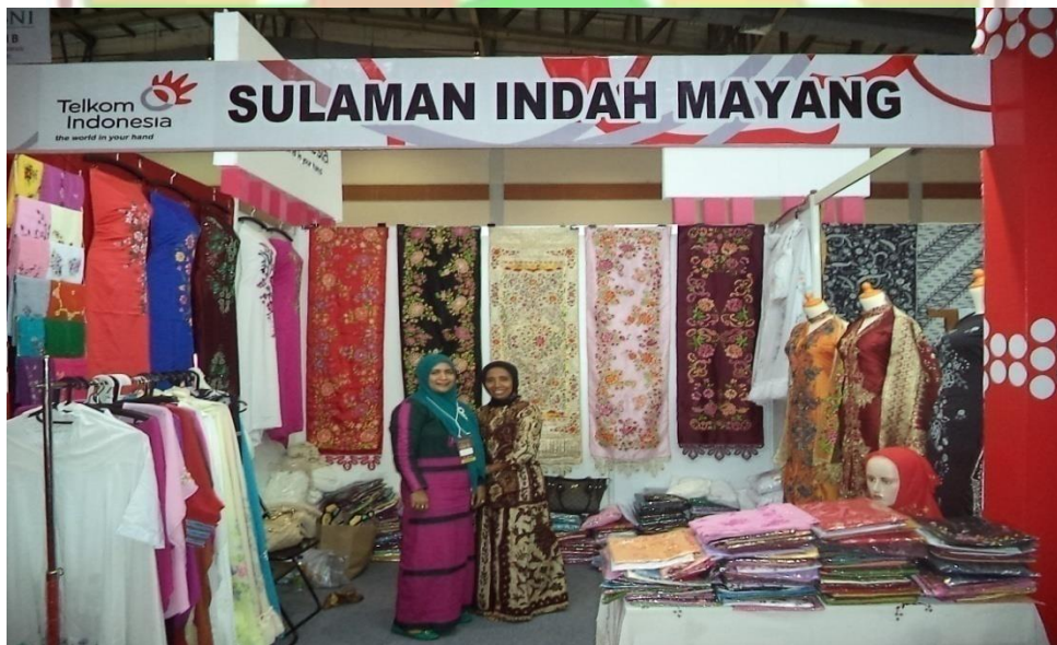
Gambar 4.2 Kegiatan Industri Mitra Binaan Telkom Witel Sumbar