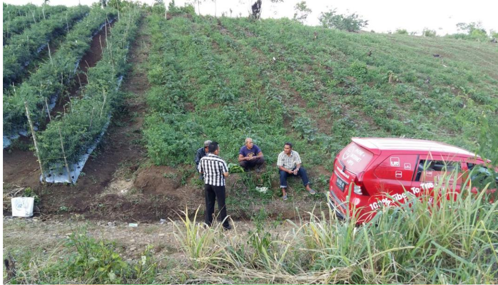
Gambar 4.3 Bidang Pertanian