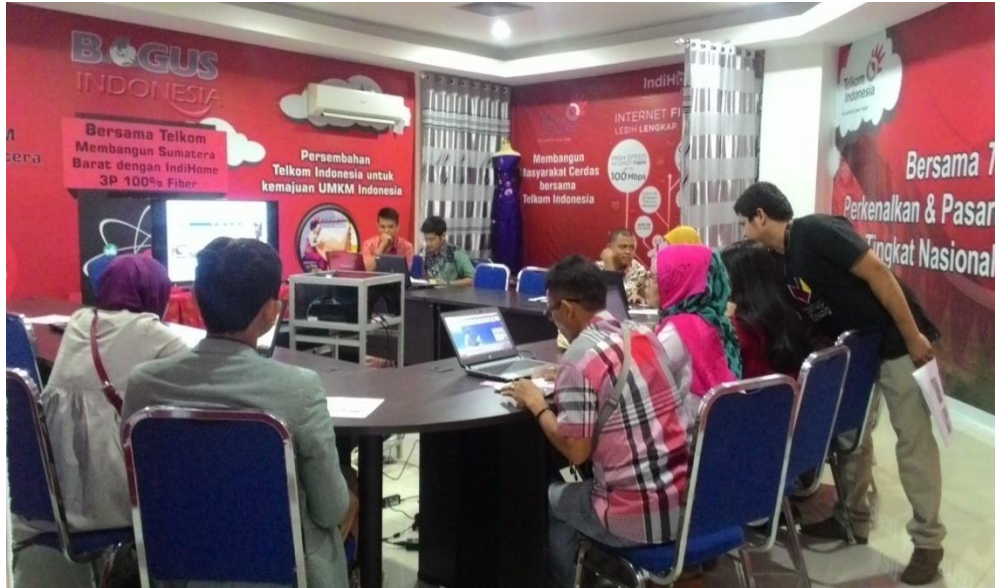
Gambar 4.5 Pelatihan dan Pembinaan UMKM