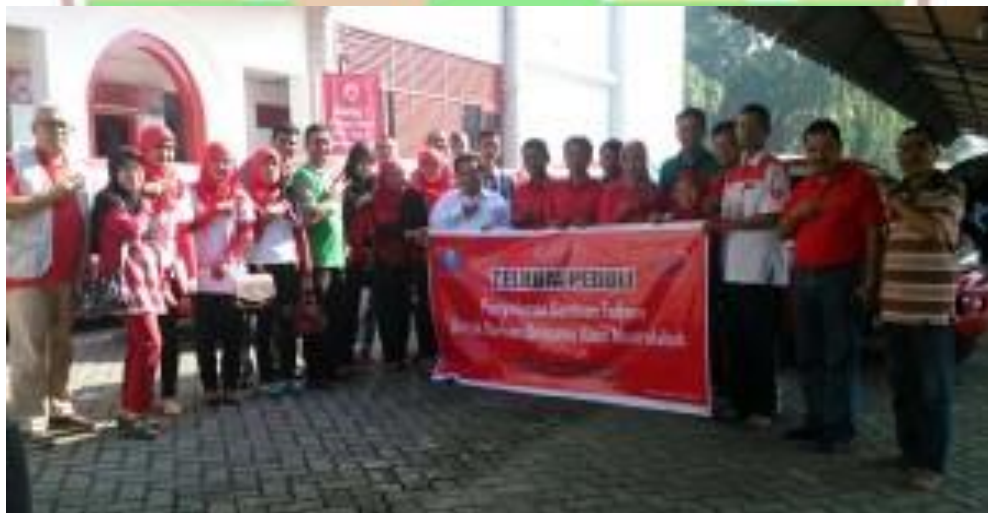
Gambar 4.6 Kegiatan Sosial Telkom Peduli

Sumber : PT. Telekomunikasi Indonesia Witel Sumbar