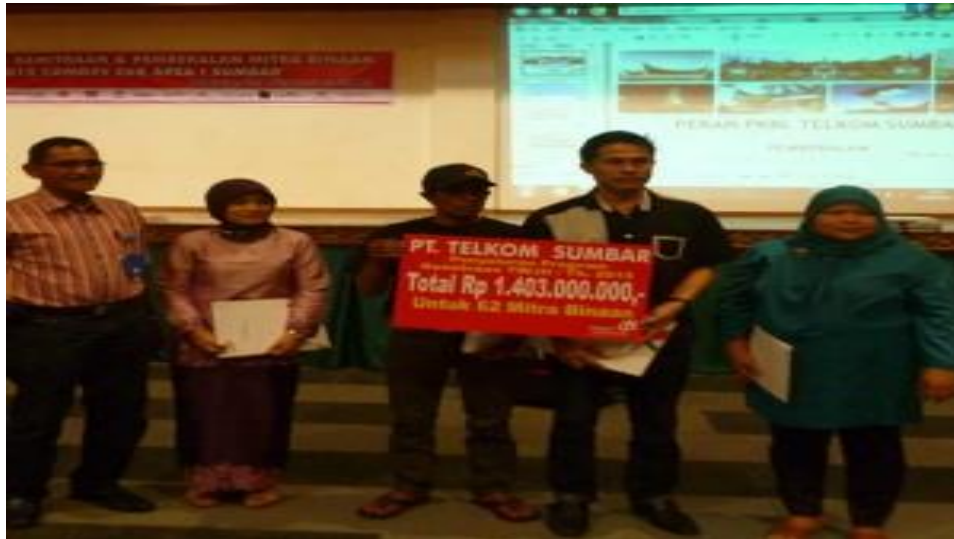
Gambar 4.1 Program Peduli UMKM Telkom Witel Sumbar