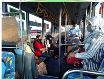
Gambar 1. 1 Situasi Trans Padang Koridor IV

Faktor yang bisa menyebabkan terjadinya kekurangan minat masyarakat adalah karena rute bus yang panjang dan jarak waktu antar bus yang lama. Pada survei awal terlihat kinerja dari bus yang belum optimal sehingga perlu dilakukan penelitian pada kinerja Trans Padang Koridor IV serta mengetahui karakteristik penumpang sebelum pengoperasian Terminal Anak Air secara maksimal untuk mendukung peningkatan kinerja Bus Trans Padang Koridor IV agar lebih optimal. Situasi Bus Trans Padang Koridor IV dapat dilihat pada Gambar 1. 1 .