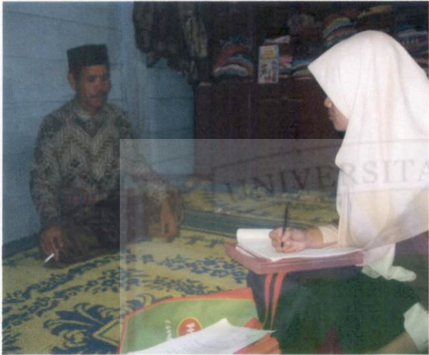
Wawancara dengan Tokoh Masyarakat