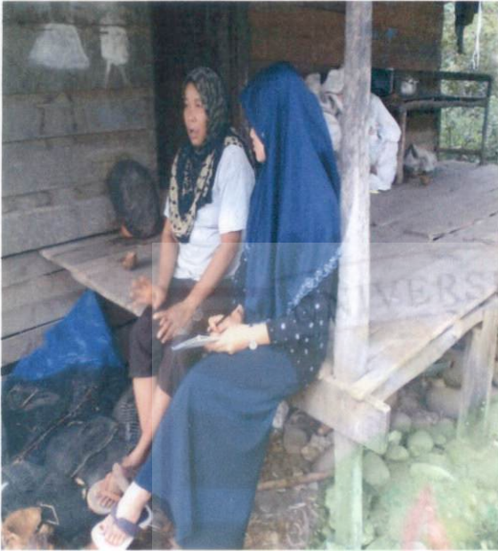
Wawancara dengan Informan Ibu Padi