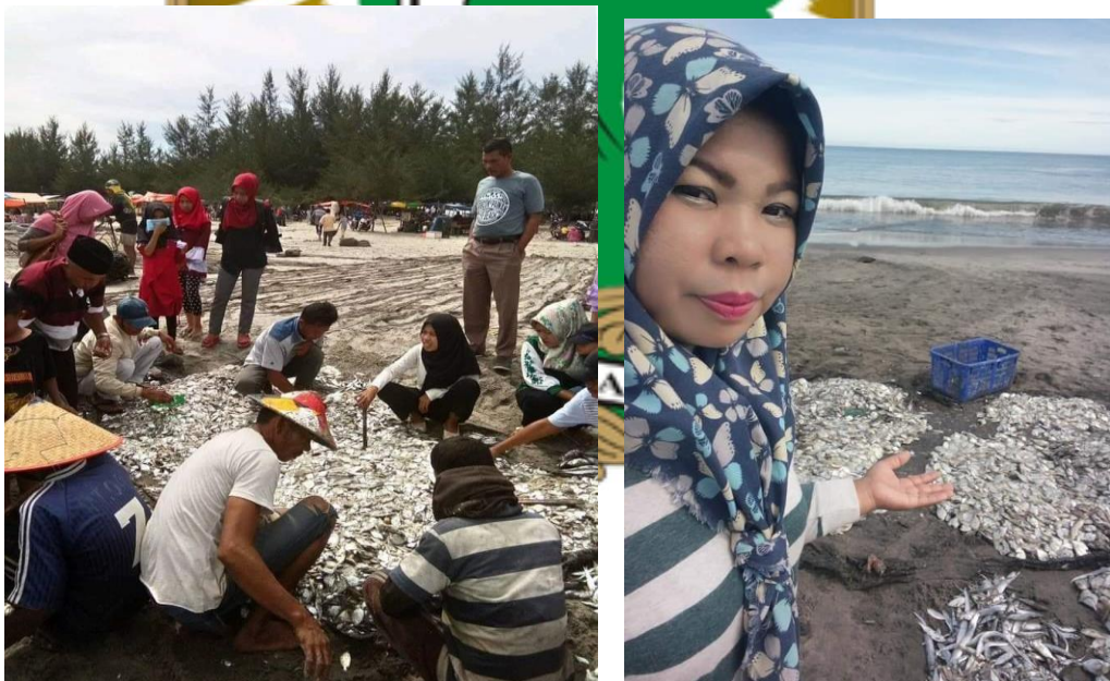
(Aktivitas Setelah penarikan pukek, pengunjung pantai mendekat dan membeli ikan).