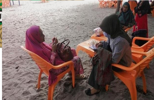
(wawancara Bersama pengunjung pantai)