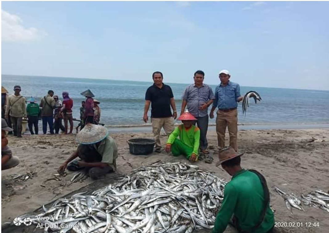
(Kegiatan maelo pukek(penarikan jala) saat keadaan sebelum pandemi Covid-19).