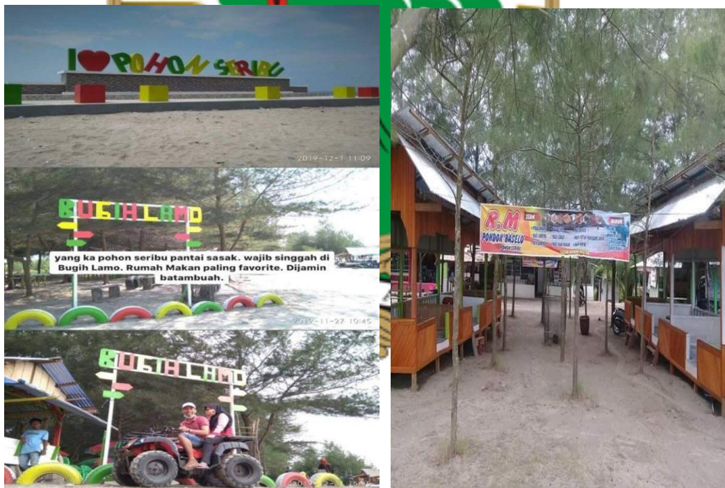
(Kondisi pantai saat pandemi Covid-19, terlihat sunyi tanpa pengunjung).