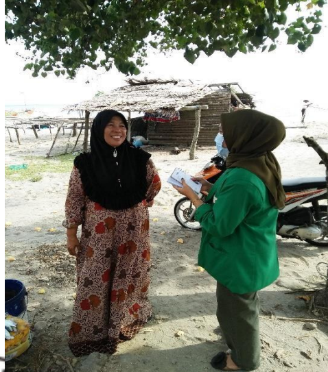
(Pengambilan data dan wawancara)