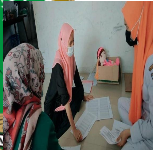
(wawancara dengan kepala UPT Puskesmas)