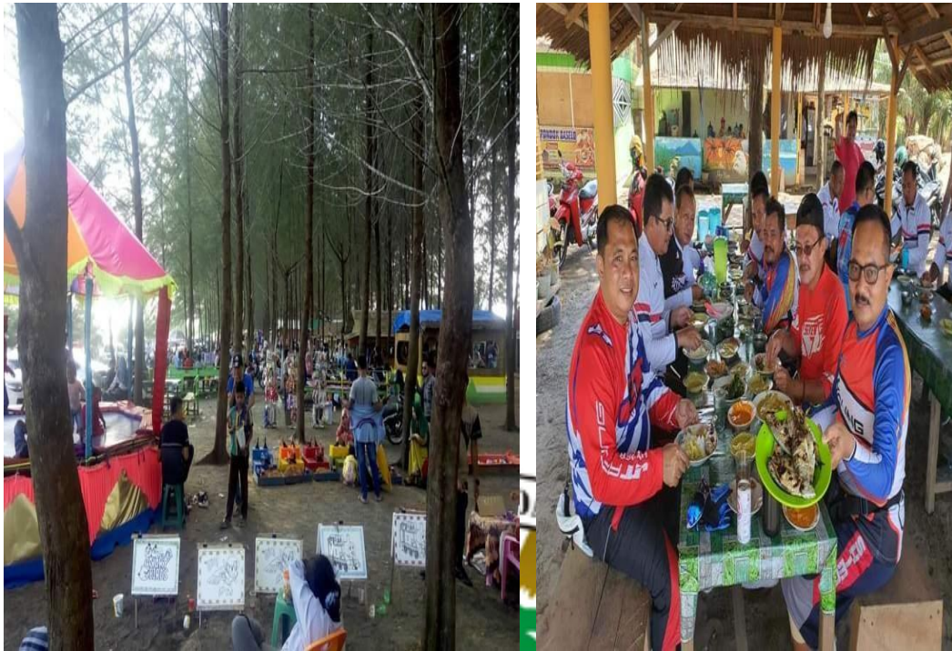
(Kondisi pantai Pohon Seribu sebelum pandemi Covid-19).