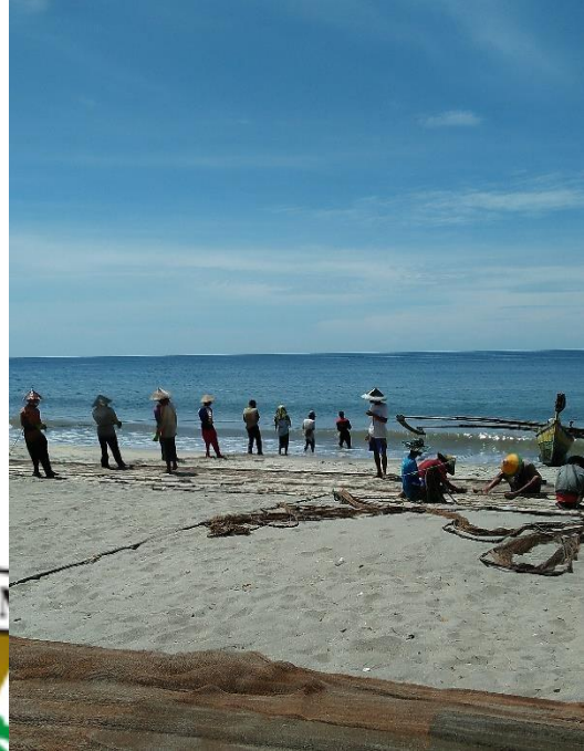
(Penampakan aktivitas masyarakat dilokasi penelitian saat pandemi Covid-19).