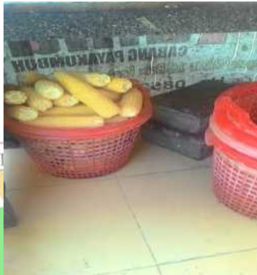
Jagung formula 1 setelah pengupasan