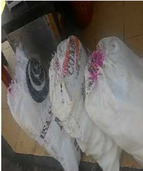
Jagung formula 1