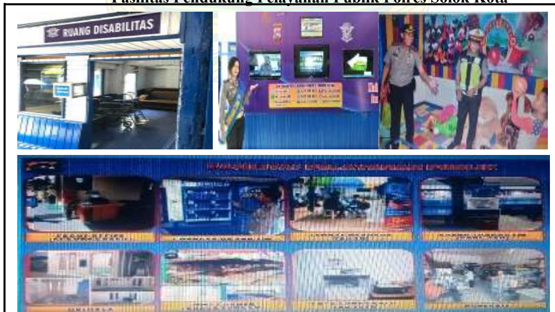
Gambar 1.2 Fasilitas Pendukung Pelayanan Publik Polres Solok Kota