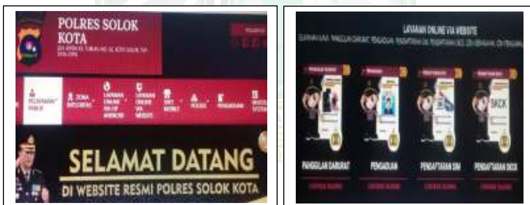
Gambar 1.3 Website Pelayanan Publik Polres Solok Kota