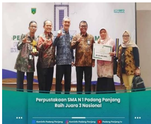
Gambar 1. 3 Perpustakaan SMAN 1 Padang Panjang Raih Juara 3 Nasional