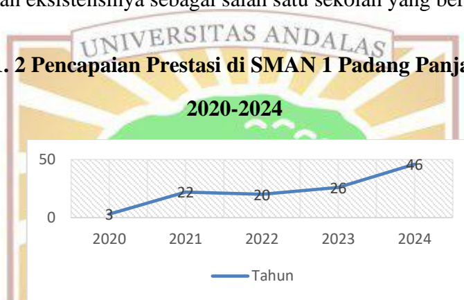
Gambar 1. 2 Pencapaian Prestasi di SMAN 1 Padang Panjang Tahun