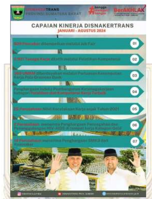
Gambar 1.1 Capaian Kinerja Disnakertrans Januari-Agustus 2024