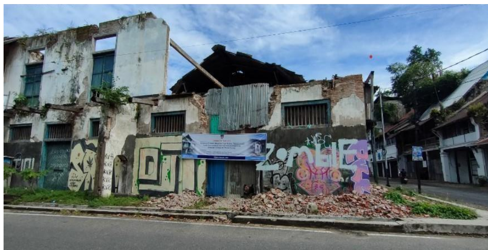
Gambar 1. 1 Bangunan Yang Dirusak (PT. Kurnia Jagad Abadi)

Pada gambar 1.1 bangunan ini hendak dialihfungsikan menjadi sebuah kafe, dalam aksi ini pemilik bangunan tidak melakukan perizinan pemugaran kepada Dinas Pendidikan dan Kebudayaan maupun Dinas PUPR Kota Padang. Hal ini bisa berdampak terhadap masyarakat lingkungan sekitar, dikarenakan adanya tindakan arogan di pihak tertentu terhadap bangunan cagar budaya. Yang dimana bangunan cagar budaya itu dilindungi oleh pemerintah. Kondisi ini menunjukkan perlunya peningkatan pengawasan dan penegakan hukm terhadap perlindungan cagar budaya di Kawasan Kota Tua, mengingat ancaman kerusakan tidak hanya berasal dari faktor alam dan kelalaian perawatan, tetapi juga dari tindakan perusakan yang dapat menghilangkan warisan budaya secara permanen.