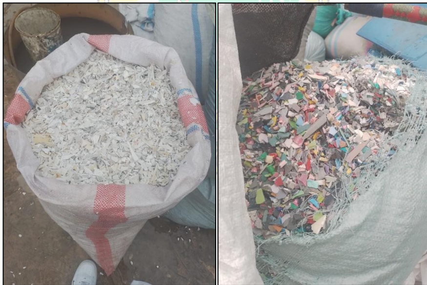
Gambar 1.1 Cacahan Plastik yang diproduksi oleh GILPLAS Sumbar

Salah satu praktek bisnis daur ulang plastik di Indonesia adalah GILPLAS Sumbar. GILPLAS Sumbar adalah badan usaha yang Beralamat di Jl. By Pass, Batipuh Panjang, Kecamatan Koto Tengah, Kota Padang, Sumatera Barat. GILPLAS Sumbar bergerak dalam bisnis daur ulang dimana sampah plastik disorting, dibersihkan dan diolah ke bentuk cacahan plastik untuk meningkatkan nilai sampah plastik tersebut di Pasar Daur ulang. Target produksi harian GILPLAS Sumbar ditetapkan sebesar 3.000 kg untuk seluruh jenis cacahan plastik. Cacahan plastik yang diproduksi oleh gilplas sumbar dapat dilihat melalui Gambar 1.1 berikut.