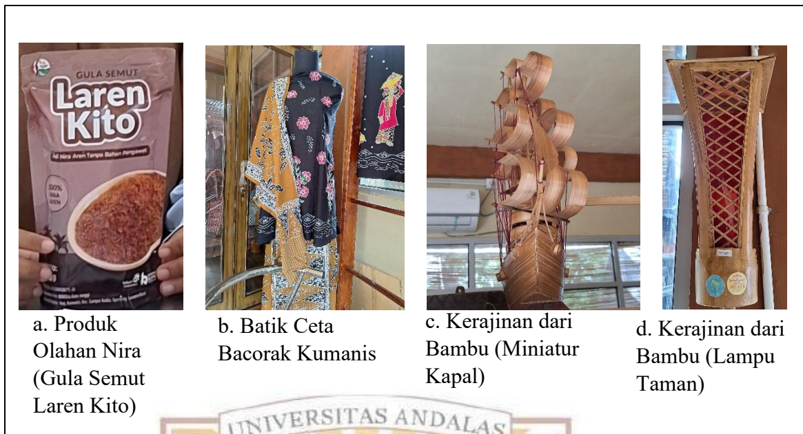
Gambar 2. Produk-Produk Ekonomi Kreatif Produksi Masyarakat di Nagari Kumanis; a. Produk Olahan Nira (Gula Semut Laren Kito), b. Batik Ceta Bacorak Kumanis, c. Kerajinan dari Bambu (Miniatur Kapal), dan d. Kerajinan dari Bambu (Lampu Taman).

Nagari Kumanis juga merupakan nagari wisata dan pada tahun 2024 Nagari Wisata Kumanis masuk dalam peringkat 300 besar desa wisata di ADWI (Anugerah Desa Wisata Indonesia). Berdasarkan hal tersebut, dapat disimpulkan bahwa sumberdaya yang dimiliki oleh Nagari Kumanis berpotensi kuat untuk memenuhi permintaan pasar wisata.