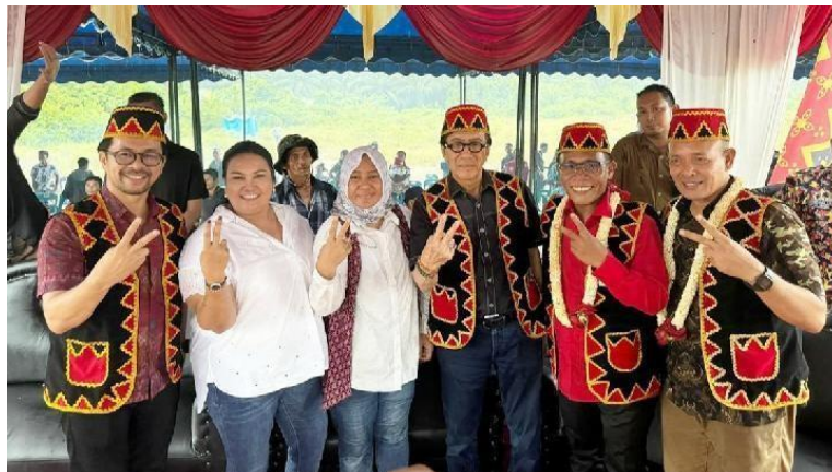
Gambar 1.4 Pelegaran Seni Budaya dan Temu Ramah tokoh inspirasi "Ono Niha" di Kecamatan Badiri Tapanuli Tengah

menjadikannya sebagai modal sosial yang menjangkau keberagaman dan akses informasi serta sumber daya baru dalam menarik dukungan masyarakat Tapanuli Tengah pada Pilkada 2024.