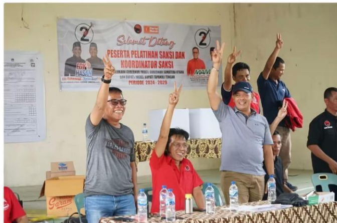
Gambar 1.1 Anggota DPR RI Adian Napitupulu memberikan dukungan legitimasi Pilkada kepada Masinton dan Mahmud