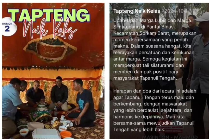
Gambar 1.3 "Upah-Upah" Marga Lubis dan Marga Simatupang