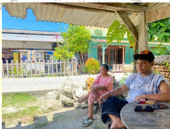
Gambar 2 Lingkungan Tempat Tinggal

Saya menuju tempat tinggal saya selama penelitian, rumah Amak Tebe yang berada di km 0, dan mulai mengenal lingkungan sosial di Dusun Jati. Ibu-ibu setempat menyambut dengan hangat dan memberikan banyak informasi mengenai mobilitas, transportasi, hingga fenomena anak remaja yang lebih memilih pergi memancing atau surfing daripada sekolah, seperti gambar dibawah ini yang menggambarkan suasana sekitar lingkungan tempat tinggal saya.