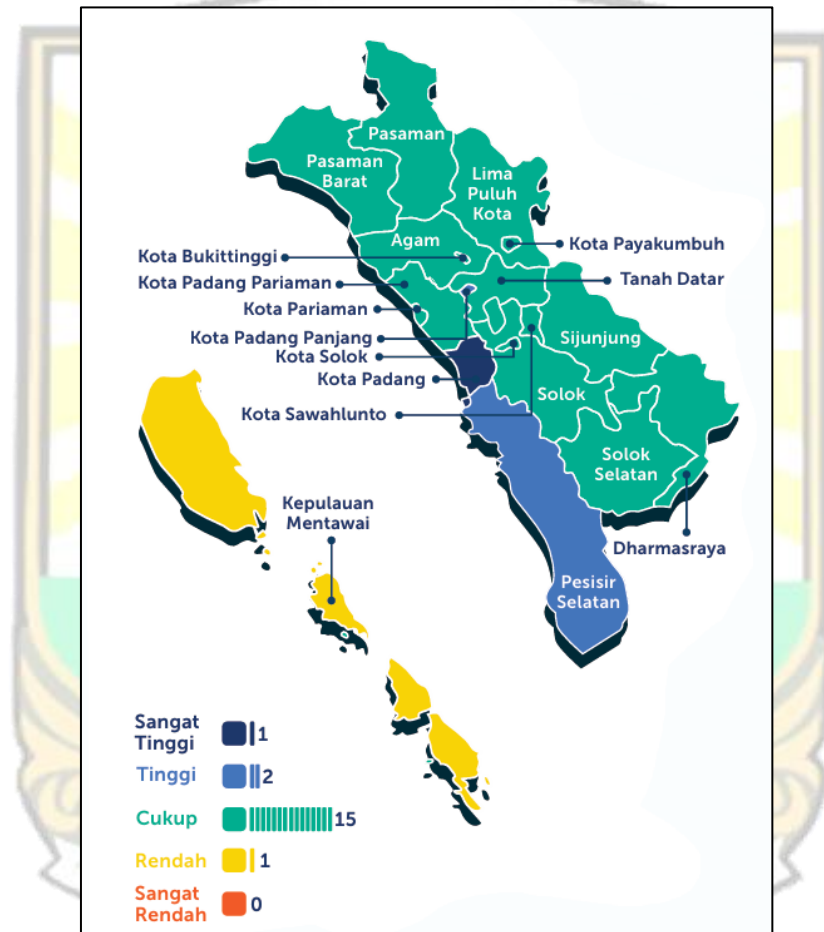
Gambar 1.2 Peta Wilayah dan Sebaran Nilai IMDI Provinsi Sumatera Barat 2024

pelaku usaha memahami cara memanfaatkannya. Sementara itu, tata kelola dan strategi menentukan arah keberlanjutan adopsi, yang perlu ditopang dengan ketersediaan anggaran agar implementasi dapat berjalan konsisten. Terakhir, aspek keamanan data dan kepatuhan regulasi menjadi faktor penentu kepercayaan, baik bagi pelaku usaha maupun konsumen. Dimensi-dimensi ini saling berkaitan dan akan menjadi pijakan dalam penelitian untuk menyusun kerangka penilaian kesiapan industri kecil di Sumatera Barat. Dengan demikian, analisis kesiapan menjadi krusial untuk mengurangi kesenjangan adopsi dan pemanfaatan teknologi AI.