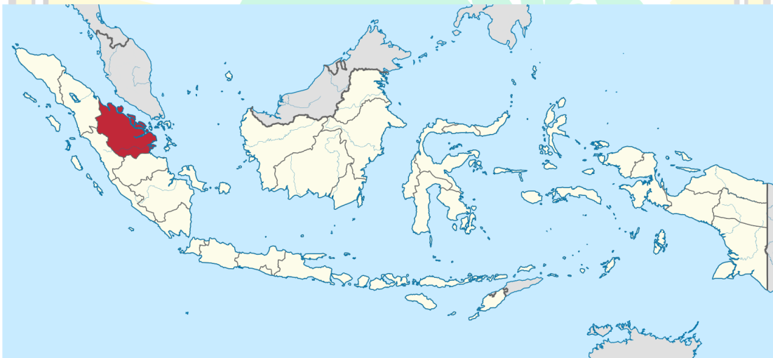
Gambar 1.1 Peta Provinsi Riau di Indonesia

dari Sumatra Tengah melalui Undang-Undang Darurat Nomor 19 Tahun 1957, yang kemudian ditegaskan kembali dalam Undang-Undang Nomor 61 Tahun 1958. 25 Dari sisi etimologi, istilah “Riau” diduga berasal dari kata Portugis rio yang berarti sungai, dan dalam sejarahnya berkaitan dengan wilayah kekuasaan Yang Dipertuan Muda di Pulau Penyengat sebelum kemudian menjadi Residentie Riouw pada masa Hindia Belanda. 26