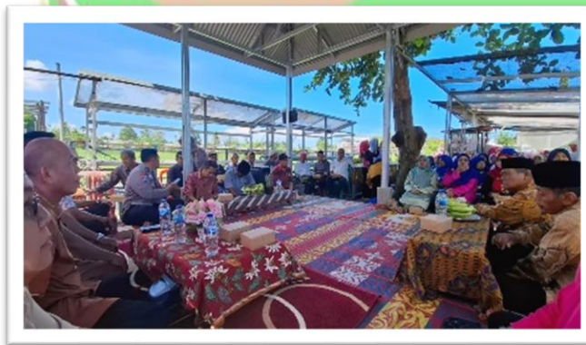
Gambar 18. Acara Reses di Kebun KWT Bunda Atirah

“...Waktu acara reses itu contohnya, lepet pisang yang dihidangkan adalah salah satu olahan yang dibuat oleh anggota KWT, walaupun dijadikan snaks setidaknya mereka sudah percaya diri untuk memperkenalkan olahan pangan lokal dan juga hasil kebun juga di suguhi seperti pisang manis...”