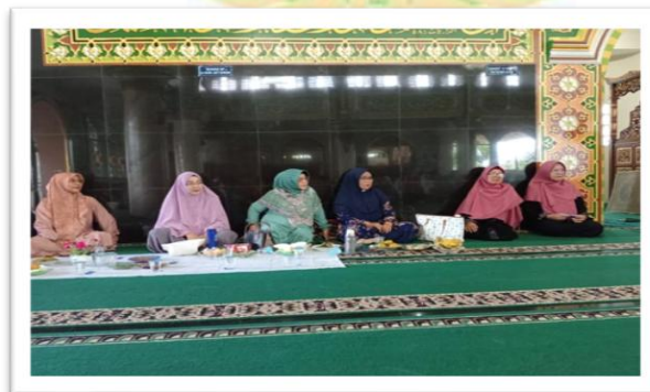
Gambar 19. Pertemuan dengan BKMT Kelurahan Surau Gadang

“...Kita bila ada pertemuan dengan kelompok lain seperti majlis biasanya ada sesi makan bersama ketika itu anggota KWT membawa olahan pangan lokal, masaknya bersama dan disepakati rumah siapa yang akan dipakai, ketika sudah matang baru dibawa. Pada waktu itulah KWT mulai mengajak dan memperkenalkan makanan pangan lokal yang menarik dan enak...”