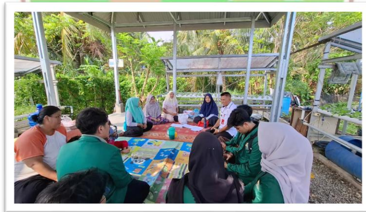
Gambar 2. Wawancara dengan Anggota KWT