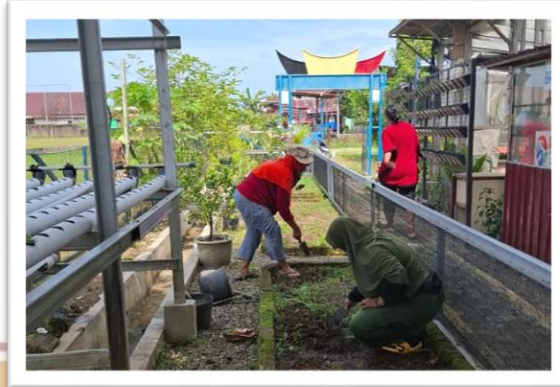
Gambar 3. Proses Pane Ubi Jalar di Kebun KWT Bunda Atirah