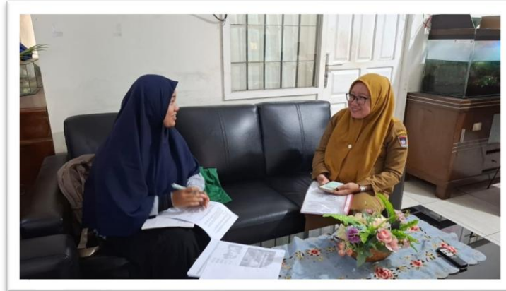
Gambar 1. Wawancara dengan Perwakilan Dinas Pangan dan Perikanan Kota Padang

kegiatan wawancara yang dilakukan peneliti bersama anggota instansi terkait dan anggota Kelompok Wanita Tani (KWT).