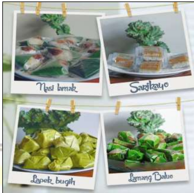
Gambar 1.2 rodok Usaha Kue Bu Ana

Usaha Kue Bu Ana hingga saat ini belum memiliki outlet resmi sebagai tempat pemasaran produk. Kegiatan produksi dilakukan di rumah produksi yang dikelola sendiri, sedangkan pemasaran produk dilakukan dengan cara menitipkan ke berbagai toko kue yang ada di Kota Padang. Beberapa toko kue yang dijadikan sebagai tempat pemasaran produk Usaha Kue Bu Ana ini antara lain Toko Ayu, Toko On, Toko Ida, Toko Nela, Toko Rizki, serta beberapa minimarket seperti Citra mart . Sebagai Industri Kecil Menengah (IKM), Usaha Kue Bu Ana memiliki omzet sekitar Rp20 juta per bulan dengan jam operasional sebanyak 8 jam kerja per hari. IKM ini mempekerjakan 8 karyawan, yang terdiri dari 7 orang bagian produksi dan pengemasan, serta 1 kurir yang bertanggung jawab mendistribusikan produk ke toko-toko. Selain itu, Usaha Kue Bu Ana juga telah memiliki sertifikasi halal sejak tahun 2024, sebagai bentuk komitmen dalam menjamin kehalalan dan keamanan produk yang dihasilkan.