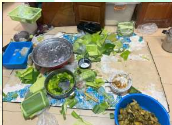
Gambar 1.4 Proses Pengolahan dilakukan di Lantai Tanpa Meja Produksi, berisiko kontaminasi debu