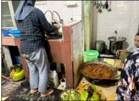
Gambar 1.3 Kondisi Dapur Produksi Berpotensi Terjadi Kontaminasi Silang

Selain itu, masih banyak lagi ditemukan aspek-aspek pengolahan makanan di Usaha Kue Bu Ana yang belum sesuai dengan Standar GMP. Berikut disajikan gambaran kondisi rumah produksi Usaha Kue Bu Ana yang tidak sesuai dengan standar GMP pada Gambar 1.3 , Gambar 1.4 , Gambar 1.5 sebagai berikut.