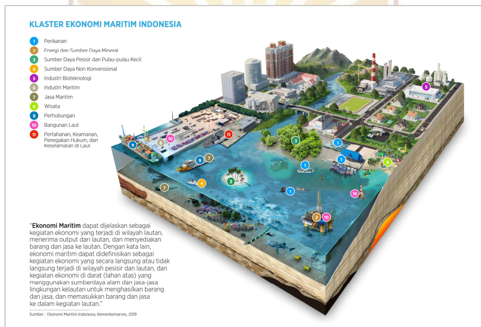
Gambar 3. Klaster Ekonomi Maritim Indonesia 8