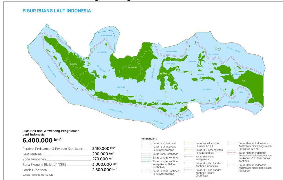
Gambar 2. Figur Ruang Laut Indonesia