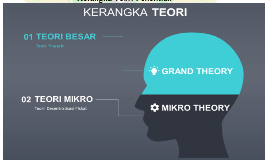
Gambar 5. Kerangka Teori Penelitian

mengumpulkan pajak, menarik retribusi dan mengelola anggaran mereka sendiri. Secara tidak langsung kewenangan ini menyatakan partisipasi masyarakat untuk lebih terlibat dalam proses pengambilan keputusan yang terkait dengan pengeluaran publik 21 . Di mana kebijakan yang akan diambil lebih sesuai dengan kebutuhan lokal karena pemerintah daerah lebih memahami konteks dan tantangan yang dihadapi. Secara umum Desentralisasi Fiskal dapat meningkatkan efisiensi dalam penggunaan sumber daya, memperbaiki layanan publik melalui pendekatan yang lebih bersifat kewilayahan. Teori ini sudah banyak di praktikan oleh negara-negara di luar Indonesia sehingga dapat dijadikan rujukan apa saja permasalahan yang dihadapi dalam implementasinya dan bagaimana negara sebagai regulator menyelesaikan permasalahan tersebut. Dengan merujuk pada peraturan per-undang - undangan dan praktik Desentralisasi Fiskal sebelum dan sesudah penetapan Undang-undang Cipta Kerja.