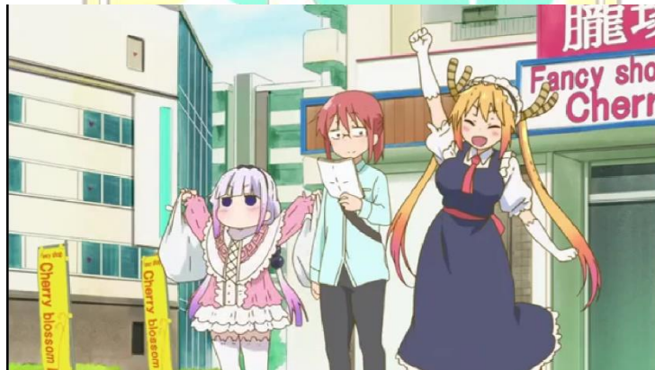
Gambar 1. Kanna, Kobayashi, dan Tohru (dari kiri ke kanan) sedang berbelanja

( Kobayashi-san chi no Meidoragon , episode 4 menit 5:21)