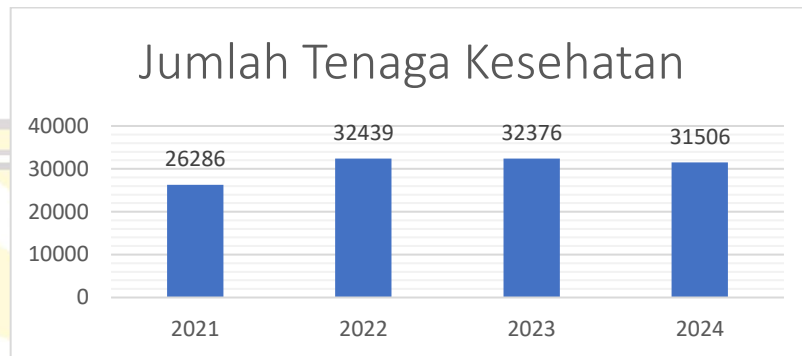
Gambar 1.2 Jumlah Tenaga Kesehatan Prov Riau

penurunan dibandingkan tahun sebelumnya. Penurunan yang terjadi mengindikasikan adanya masalah retensi SDM yang dapat mengancam kualitas pelayanan kesehatan di wilayah ini.