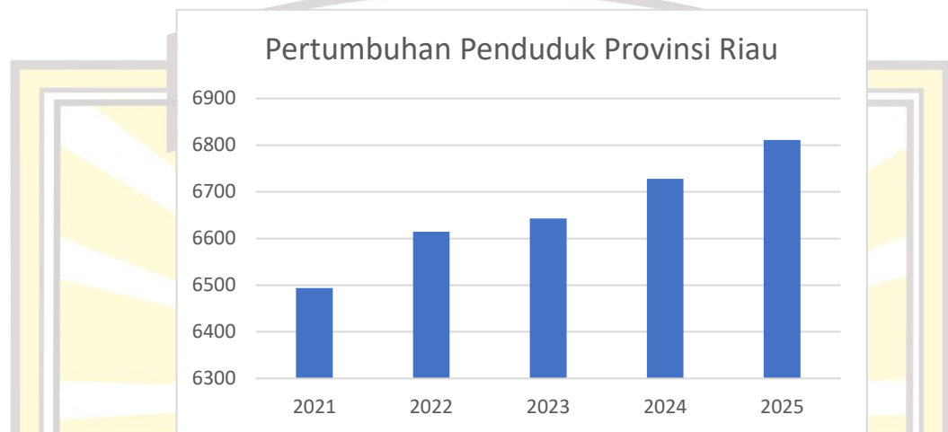
Gambar 1.4 Pertumbuhan Penduduk Provinsi Riau

permasalahan terjadi pada tahun 2025 dengan lonjakan drastis menjadi 12 karyawan keluar. Fenomena ini sejalan dengan temuan BPS Riau (2024), dimana turnover tenaga kesehatan di rumah sakit swasta mencapai 12% secara keseluruhan, lebih tinggi dari rata-rata nasional, dan berkontribusi terhadap kekurangan SDM.