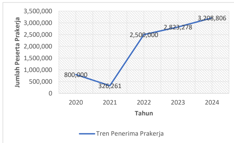
Gambar 1.1 Tren Penerimaan Prakerja di Provinsi Jawa Barat (2020-2024)

Berdasarkan data tren penerima Program Kartu Prakerja, terjadi peningkatan signifikan dalam jumlah peserta sejak tahun 2022, dari hanya 326 ribu pada 2021 menjadi lebih dari 2,5 juta pada 2022, dan terus meningkat hingga mencapai 3,2 juta pada 2024. Lonjakan ini mencerminkan perluasan skala program dan meningkatnya kepercayaan masyarakat terhadap efektivitas Prakerja sebagai solusi peningkatan keterampilan. Namun, partisipasi yang tinggi tersebut perlu diimbangi dengan evaluasi empiris untuk memastikan bahwa program benar-benar berdampak pada peningkatan status ketenagakerjaan pemuda, khususnya di wilayah dengan tingkat pengangguran tinggi seperti Jawa Barat.