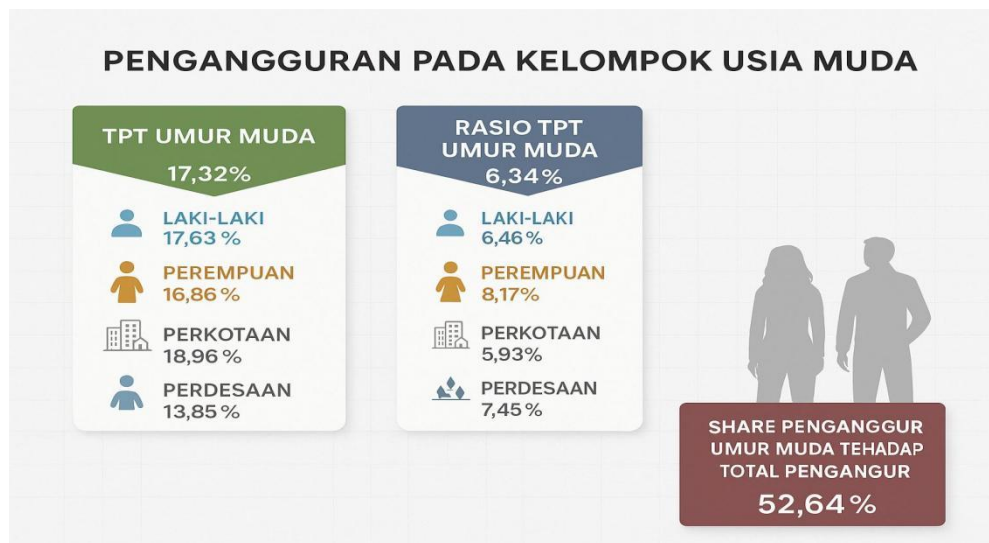
Gambar 1.2 Tingkat Pengangguran Terbuka Indonesia

Berdasarkan sejumlah studi literatur, tingginya angka pengangguran usia muda di Indonesia disebabkan oleh beragam faktor. Sebuah studi oleh Herawatie et al., (2024) menyoroti bahwa pengangguran di Indonesia tidak hanya berdampak pada aspek ekonomi, tetapi juga menciptakan tantangan sosial yang signifikan. Faktor-faktor seperti pertumbuhan populasi, kondisi ekonomi, kebijakan pemerintah, dan tingkat pendidikan berkontribusi terhadap tingginya angka pengangguran. Dampaknya meliputi penurunan pendapatan, meningkatnya kemiskinan, dan risiko kejahatan. Solusi yang diusulkan mencakup kerja sama antara pemerintah, sektor swasta, dan masyarakat untuk mendorong pertumbuhan ekonomi, meningkatkan kualitas pendidikan, serta menyediakan pelatihan keterampilan dan bantuan sosial. Tingkat pengangguran usia muda di Indonesia mencapai sekitar 16,3% dari total populasi muda sekitar 44 juta orang. Tingginya angka ini menimbulkan kekhawatiran terhadap ketahanan pangan dan stabilitas sosial di Indonesia, sehingga diperlukan intervensi kebijakan yang tepat untuk mengatasi masalah ini (Padillah & Saputra, 2024)