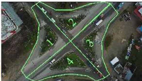
Gambar 1.3 Pembagian zona untuk kejadian konflik simpang Rumbio (Jl. By Pass Ktk – Jl. Nasir Sutan Pamuncak – Jl Pulai – Jl. Datuak Perpatih Nan Sabatang)