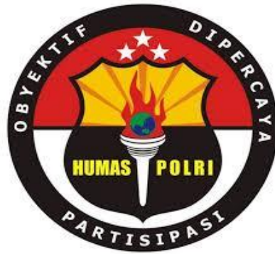
Gambar 1.1 Logo Humas Polri Obyektif, Dipercaya dan Partisipasi (Sumber, Humas Polda Sumbar)

Objektif dalam hal ini yaitu memberikan informasi secara objektif mengenai keadaan yang sebenarnya sehingga dapat membentuk opini dan citra positif terhadap institusi Polri, sementara dipercaya yaitu melalui informasi dan komunikasi yang dilakukan dapat membangun kepercayaan masyarakat terhadap Polri, dan partisipasi yaitu dari rasa kepercayaan masyarakat terhadap Polri tersebut maka akan tercipta partisipasi masyarakat dalam mewujudkan tugas Polri sebagai pelindung, pengayom dan pelayan masyarakat (Humas Polda Sumbar, 2017). Dengan kata lain motto dari humas Polri tersebut merupakan fungsi dari humas itu sendiri. Oleh karena itu dalam melaksanakan tugasnya, kinerja yang hendak dicapai oleh humas Polri yaitu terlaksananya fungsi humas polri secara maksimal dimana melalui komunikasi objektif yang diberikan dapat terbangun kepercayaan masyarakat sehingga masyarakat memberikan umpan balik berupa partisipasi dalam menjaga kamtibmas. Untuk mewujudkan tercapainya fungsi humas secara maksimal tentunya terdapat aktivitas-aktivitas komunikasi yang dilakukan oleh Humas Polri karena pelaksanaan fungsi humas tidak luput dari pengkomunikasian kinerja Polri.