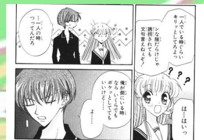
Gambar 1. 2