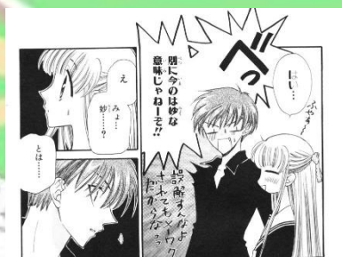
Gambar 1. 1