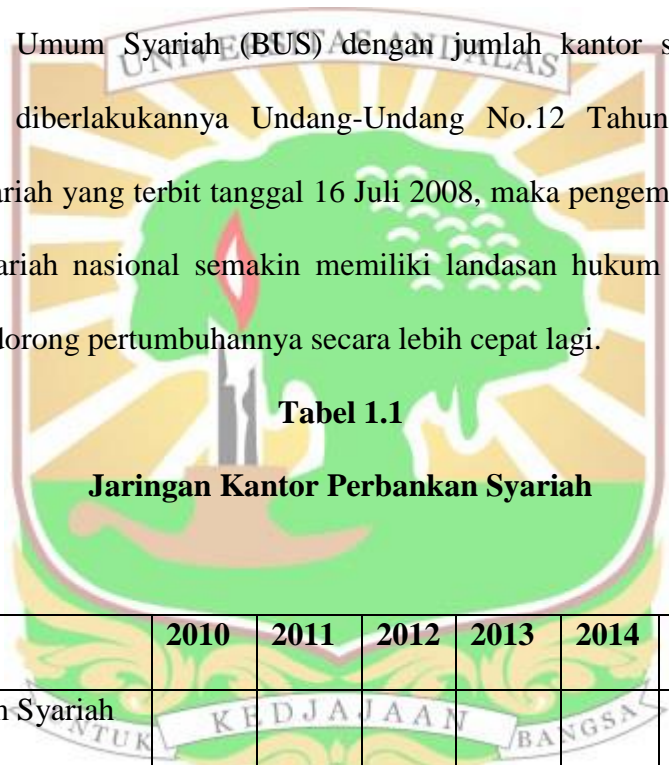
Tabel 1.1 Jaringan Kantor Perbankan Syariah

Kenyataan bahwa perbankan syariah di Indonesia mengalami perkembangan dari tahun ke tahun. Khusus industri perbankan syariah, data OJK per Oktober 2016 menunjukkan jumlah bank syariah di Indonesia saat ini terdiri dari 13 Bank Umum Syariah (BUS) dengan jumlah kantor sebanyak 1885. Dengan telah diberlakukannya Undang-Undang No.12 Tahun 2008 tentang Perbankan Syariah yang terbit tanggal 16 Juli 2008, maka pengembangan industri Perbankan Syariah nasional semakin memiliki landasan hukum yang memadai dan akan mendorong pertumbuhannya secara lebih cepat lagi.