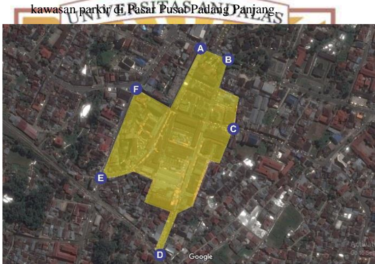
Gambar 1.3 Titik-titik Lokasi Penelitian