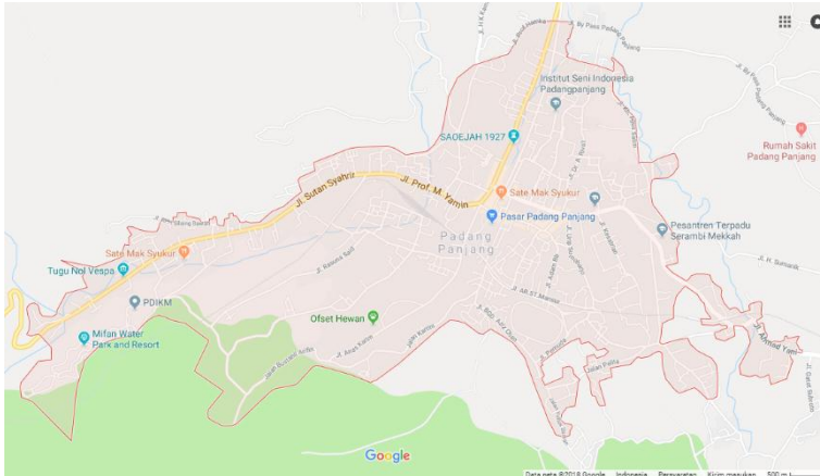
Gambar 1.2 Peta Kota Padang Panjang

Menurut Badan Pusat Statistik, jumlah penduduk pada tahun 2010 sebanyak 47.198 jiwa, tahun 2015 berjumlah 50.883 jiwa, sedangkan pada tahun 2016 kota Padang Panjang memiliki jumlah penduduk sebanyak 51.712 jiwa. Dari data tersebut dapat disimpulkan bahwa jumlah penduduk kota Padang Panjang mengalami peningkatan. Hal ini menunjukkan adanya pertumbuhan jumlah penduduk kota Padang Panjang semakin meningkat dari tahun ke tahun.