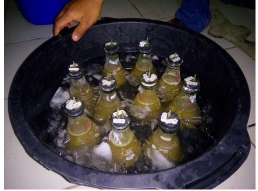
Pendinginan setelah in-vitro