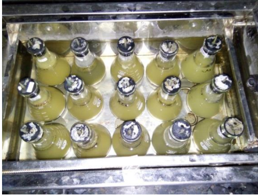
Sampel in-vitro dalam shaker waterbath