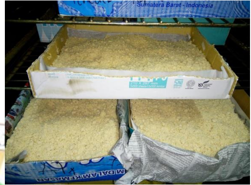
Ampas tahu di dalam oven 60°C