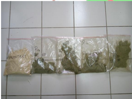
Konsentrat dan hijauan