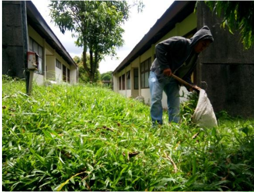
Pengambilan rumput lapangan