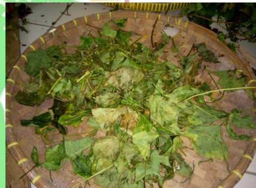
Sisa panen bengkung