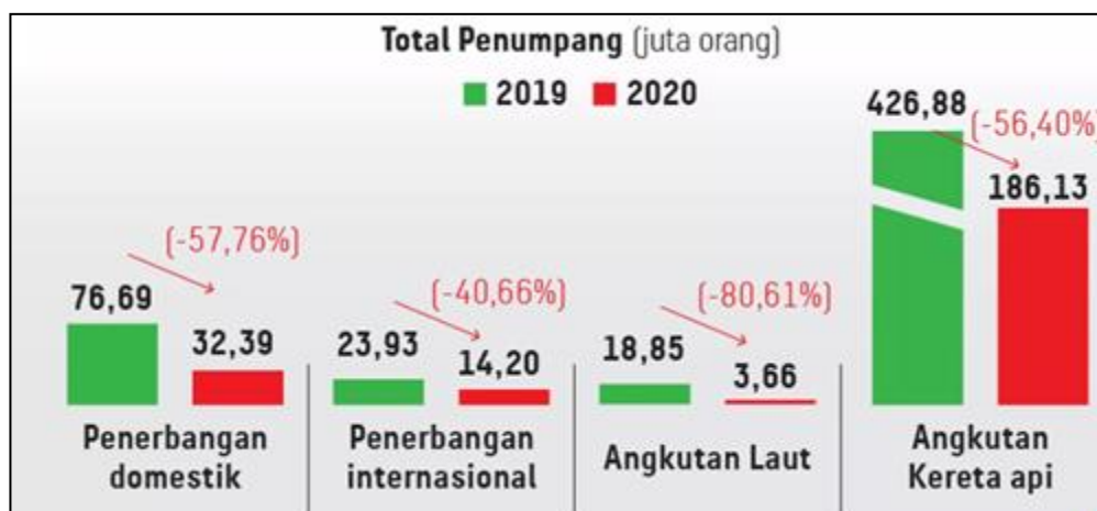
Gambar 1.2 Total Penumpang Angkutan 2019-2020