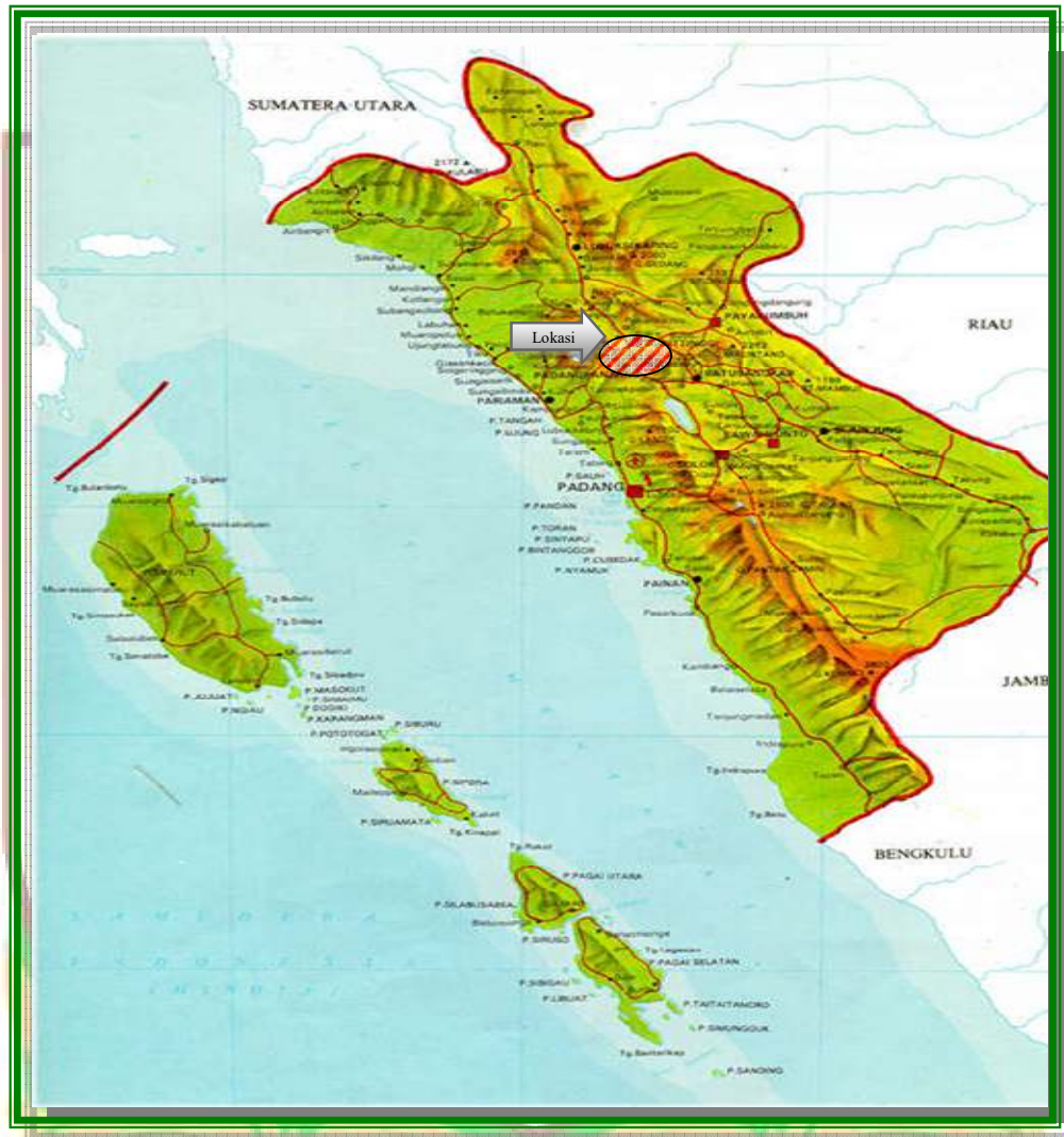
Gambar 1.1 Peta Propinsi Sumatera Barat

Kegiatan pekerjaan ini berlokasi tersebar di Kota Bukittinggi